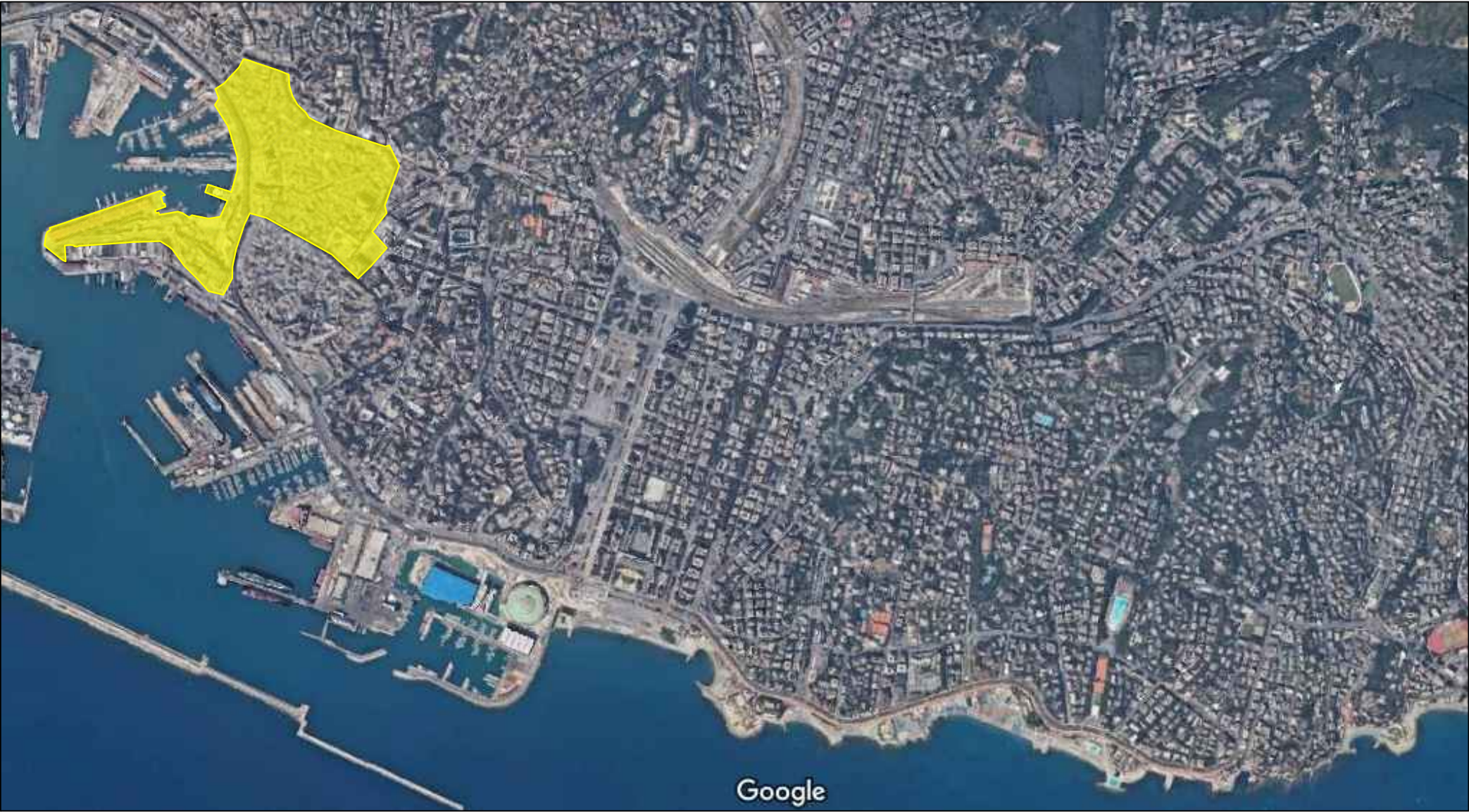
INQUADRAMENTO ZONA GIALLA