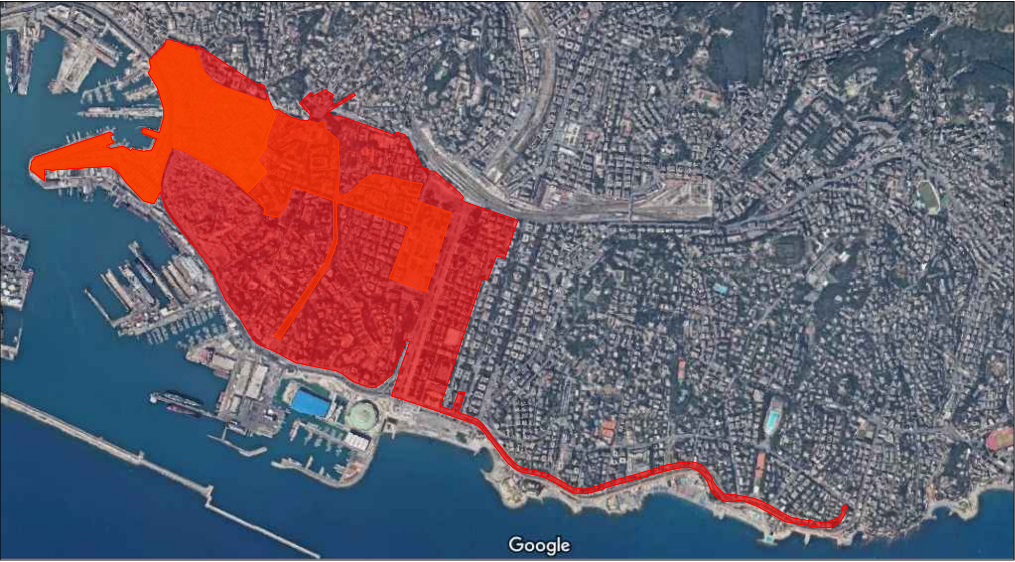
INQUADRAMENTO ZONA ROSSA