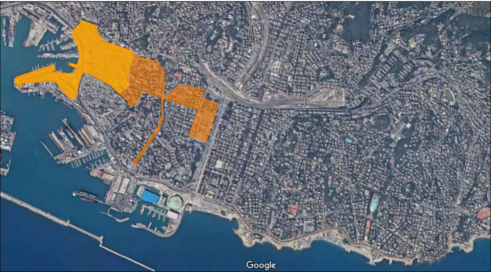
INQUADRAMENTO ZONA ARANCIONE