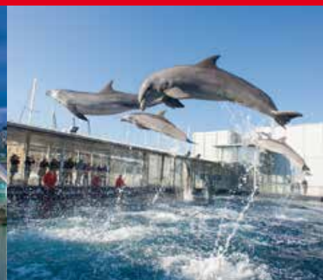
à gauche: Vue du centre historique, le vieux port, L'Aquarium ci dessous: Palazzo Rosso