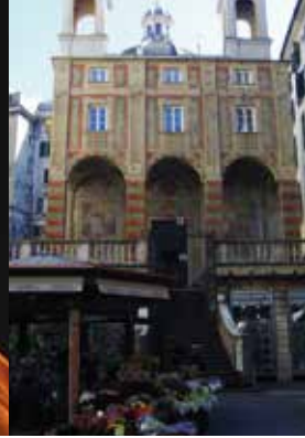
von links: Palazzo Ducale, Kathedrale San Lorenzo, Kirche San Pietro in Banchi unten von links: Porta Soprana, Boccadasse, Grab Oneto auf dem Monumental- Friedhof Staglieno

Mittelmeerraum, mit dem davorliegenden U-Boot Nazario Sauro. Leitfaden ist die lebenswichtige Beziehung zwischen Mensch und Meer: 5 Minuten von hier befindet sich die romanische Kirche S. Giovanni di Prè und das Theatermuseum Commenda mit einer Multimedia-Inszenierung, die diese antiken Gemäuer mit Persönlichkeiten aus dem Mittelalter belebt. (99-A4).